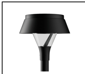
SKVER Hood ULR příklad 2 RAL9005 (421518)