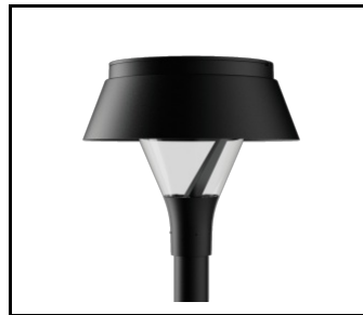
SKVER Hood ULR příklad 2 RAL9005 (421518)