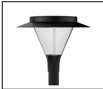
SKVER Hood příklad 1 RAL9005 (435522)