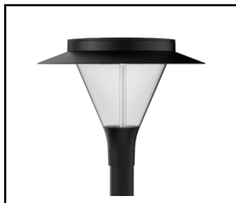
SKVER Hood příklad 1 RAL9005 (435522)