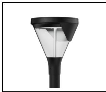
SKVER Backshield RAL9005 (435515)