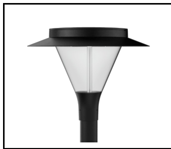
SKVER Hood příklad 1 RAL9005 (435522)