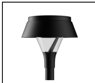
SKVER Hood ULR příklad 2 RAL9005 (421518)