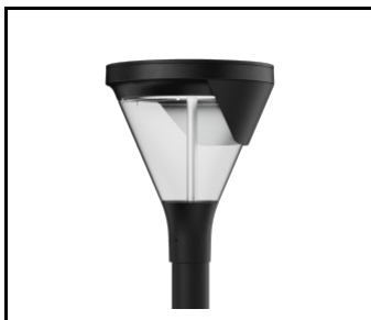
SKVER Backshield RAL9005 (435515)