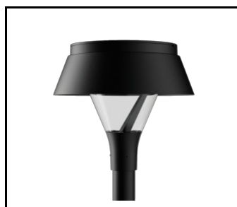
SKVER auvent ULR modèle 2 RAL9005 (421518)

Date de création de la carte: 21 octobre 2024