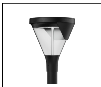
SKVER Backshield RAL9005 (435515)