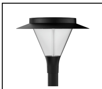
SKVER auvent. modèle 1 RAL9005 (435522)