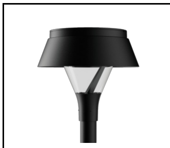
SKVER auvent ULR modèle 2 RAL9005 (421518)

Date de création de la carte: 21 octobre 2024