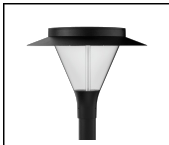
SKVER auvent. modèle 1 RAL9005 (435522)

Date de création de la carte: 21 octobre 2024