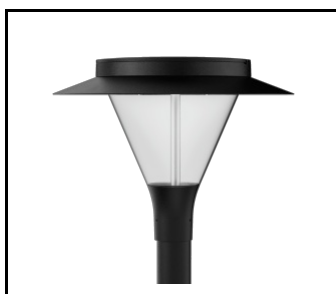
SKVER auvent. modèle 1 RAL9005 (435522)