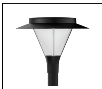
SKVER auvent. modèle 1 RAL9005 (435522)