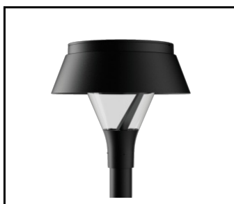
SKVER auvent ULR modèle 2 RAL9005 (421518)

Date de création de la carte: 21 octobre 2024