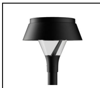
SKVER auvent ULR modèle 2 RAL9005 (421518)

Date de création de la carte: 21 octobre 2024