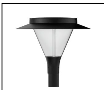
SKVER auvent. modèle 1 RAL9005 (435522)