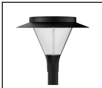
SKVER auvent. modèle 1 RAL9005 (435522)

Date de création de la carte: 21 octobre 2024