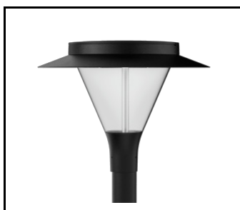
SKVER Reflektor Muster 1 RAL9005 (435522)