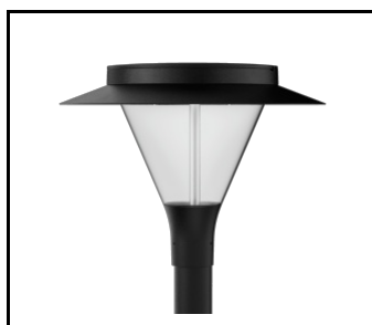
SKVER Reflektor Muster 1 RAL9005 (435522)