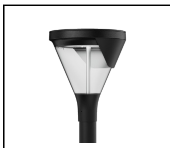
SKVER Backshield RAL9005 (435515)