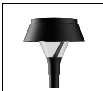
SKVER Reflektor ULR Muster 2 RAL9005 (421518)

Erstellungsdatum der Karte: 21 October 2024