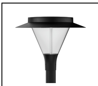
SKVER Daszek wzór 1 RAL9005 (435522)