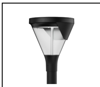
SKVER Backshield RAL9005 (435515)