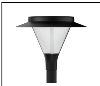
SKVER Daszek wzór 1 RAL9005 (435522)