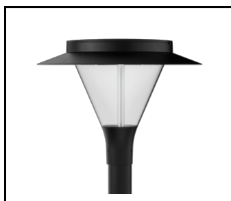
SKVER Daszek wzór 1 RAL9005 (435522)