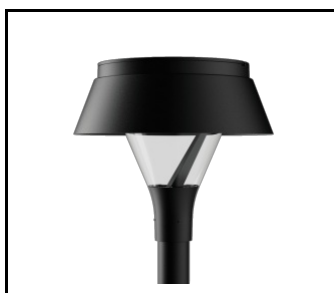
SKVER Daszek ULR wzór 2 RAL9005 (421518)