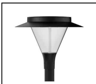
SKVER Daszek wzór 1 RAL9005 (435522)