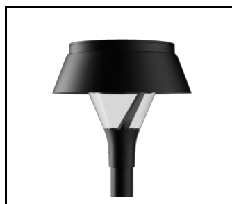
SKVER Daszek ULR wzór 2 RAL9005 (421518)