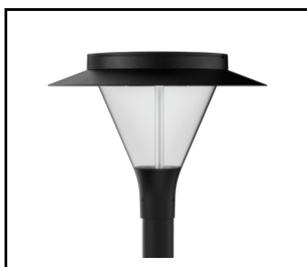
SKVER Daszek wzór 1 RAL9005 (435522)