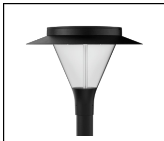
SKVER Daszek wzór 1 RAL9005 (435522)