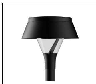
SKVER Daszek ULR wzór 2 RAL9005 (421518)