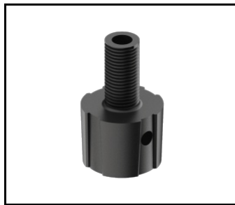
SKVER R vnější závit adaptéru M20x40 (rozteč 2,5) (804427)