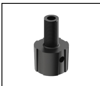
SKVER R vnější závit adaptéru M20x40 (rozteč 2,5) (804427)