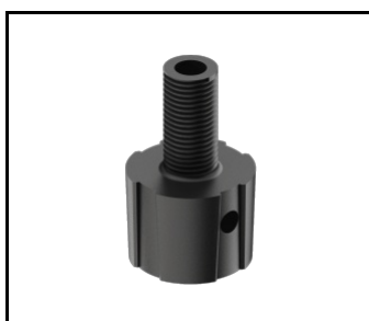
SKVER R vnější závit adaptéru M20x40 (rozteč 2,5) (804427)