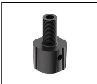
SKVER R vnější závit adaptéru M20x40 (rozteč 2,5) (804427)