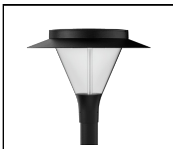
SKVER auvent. modèle 1 RAL9005 (435522)