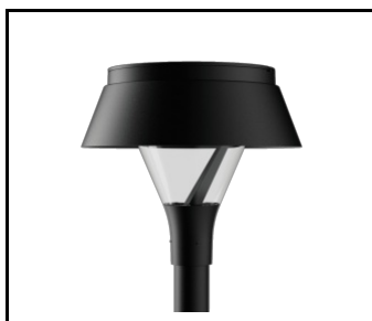
SKVER auvent ULR modèle 2 RAL9005 (421518)