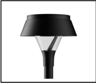
SKVER auvent ULR modèle 2 RAL9005 (421518)