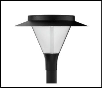
SKVER auvent. modèle 1 RAL9005 (435522)