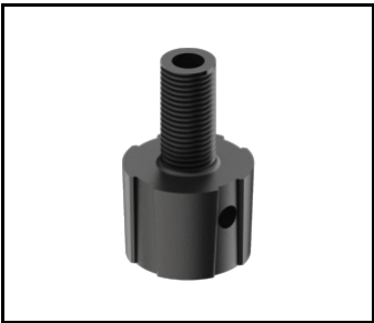
Adaptateur mâle SKVER R filetage M20x40 (pas 2,5) (804427)