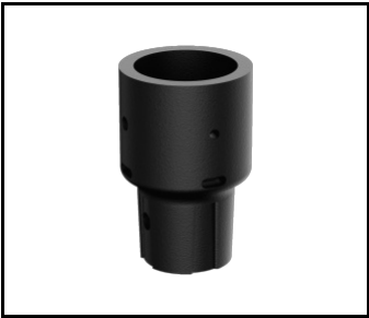
SKVER adaptateur externe fi48 (804571)