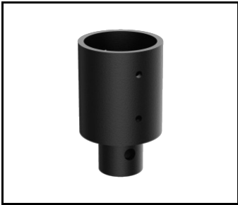
SKVER adaptateur externe fi60 (804588)