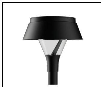
SKVER auvent ULR modèle 2 RAL9005 (421518)