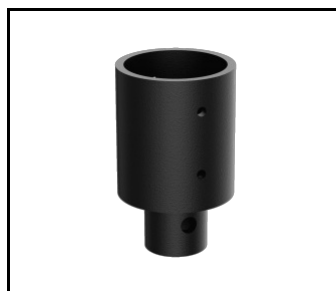
SKVER adaptateur externe fi60 (804588)