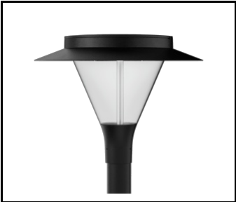
SKVER auvent. modèle 1 RAL9005 (435522)