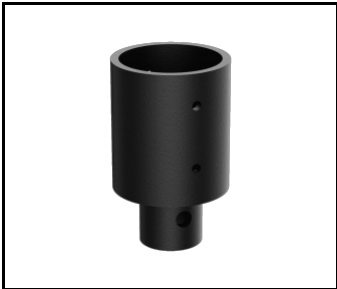
SKVER adaptateur externe fi60 (804588)