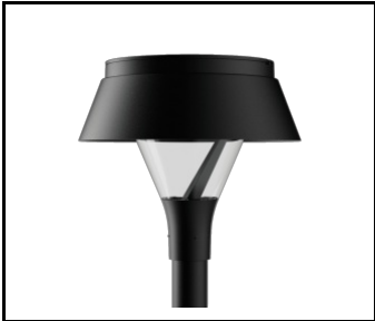
SKVER auvent ULR modèle 2 RAL9005 (421518)