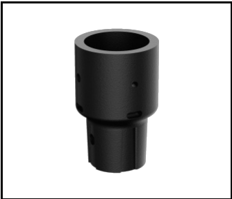
SKVER adaptateur externe fi48 (804571)