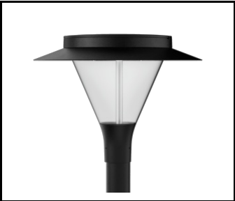
SKVER auvent. modèle 1 RAL9005 (435522)