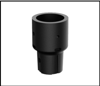
SKVER adaptateur externe fi48 (804571)