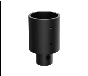
SKVER adaptateur externe fi60 (804588)