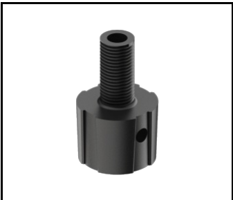
Adaptateur mâle SKVER R filetage M20x40 (pas 2,5) (804427)