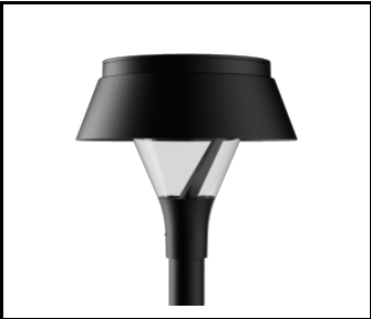
SKVER auvent ULR modèle 2 RAL9005 (421518)