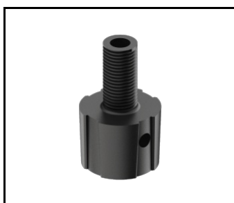
Adaptateur mâle SKVER R filetage M20x40 (pas 2,5) (804427)