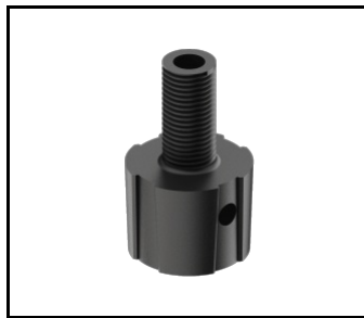
Adaptateur mâle SKVER R filetage M20x40 (pas 2,5) (804427)