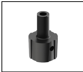
SKVER R Außengewindeadapter M20x40 (Steigung 2,5) (804427)