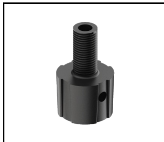
SKVER R Außengewindeadapter M20x40 (Steigung 2,5) (804427)