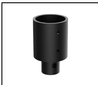
SKVER externer Adapter fi60 (804588)