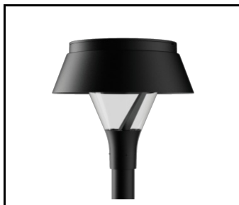
SKVER Reflektor ULR Muster 2 RAL9005 (421518)