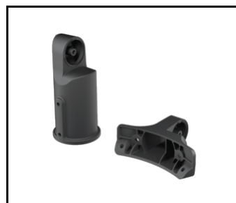
SKVER R Verstellbarer Griff Dark Sky schwarz (804618)

Erstellungsdatum der Karte: 24 April 2025