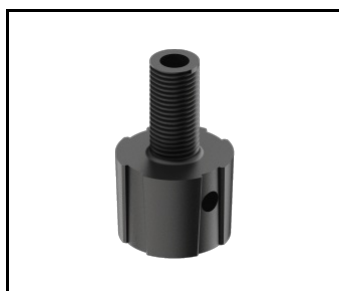
SKVER R Außengewindeadapter M20x40 (Steigung 2,5) (804427)