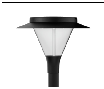
SKVER Reflektor Muster 1 RAL9005 (435522)