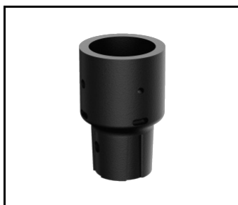
SKVER externer Adapter fi48 (804571)