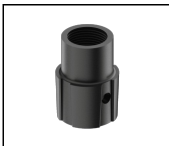
SKVER R adapter żeński gwint 1 cal x40 (gaz) (804441)