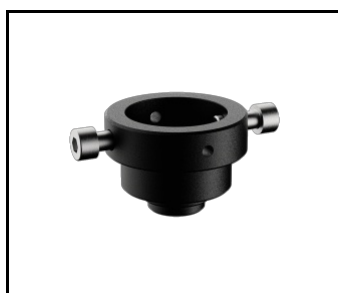
Wzornik wiertarski (449017)