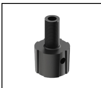
SKVER R adapter męski gwint M20x40 (skok 2,5) (804427)