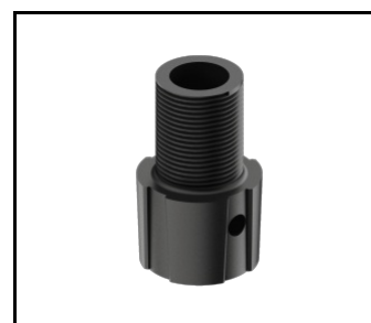
SKVER R adapter męski gwint 1 cal x40 (gaz) (804434)