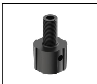
SKVER R adapter męski gwint M20x40 (skok 2,5) (804427)