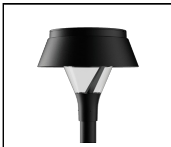
SKVER Daszek ULR wzór 2 RAL9005 (421518)