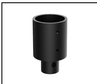
SKVER adapter zewnętrzny fi60 (804588)