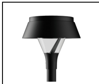
SKVER Daszek ULR wzór 2 RAL9005 (421518)