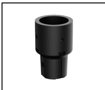
SKVER adapter zewnętrzny fi48 (804571)