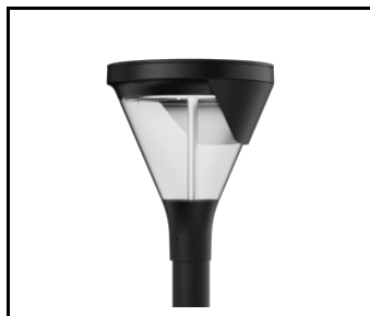
SKVER Backshield RAL9005 (435515)