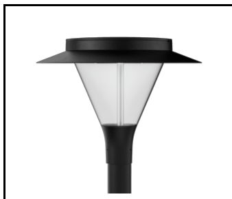
SKVER Daszek wzór 1 RAL9005 (435522)