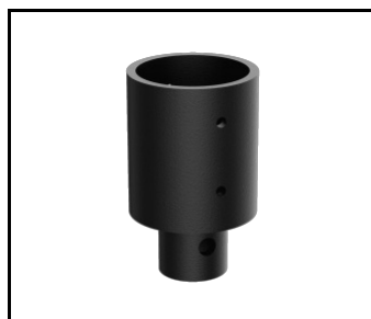
SKVER adapter zewnętrzny fi60 (804588)