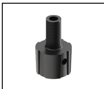
SKVER R adapter męski gwint M20x40 (skok 2,5) (804427)