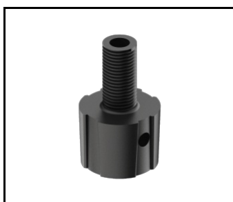
SKVER R adapter męski gwint M20x40 (skok 2,5) (804427)