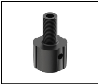
SKVER R adapter męski gwint M20x40 (skok 2,5) (804427)