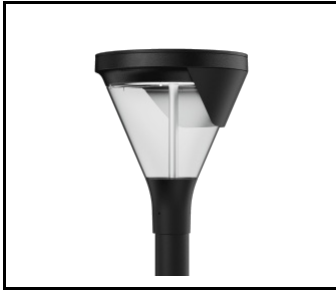
SKVER Backshield RAL9005 (435515)