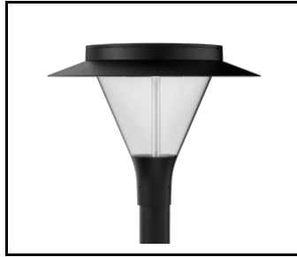
SKVER Daszek wzór 1 RAL9005 (435522)