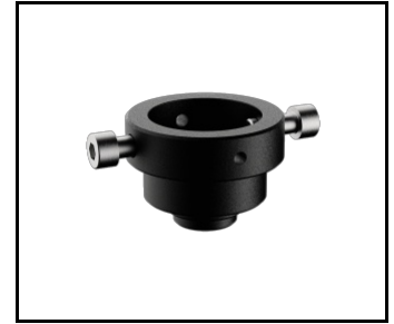
Wzornik wiertarski (449017)