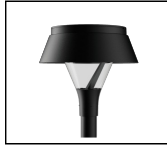
SKVER Daszek ULR wzór 2 RAL9005 (421518)