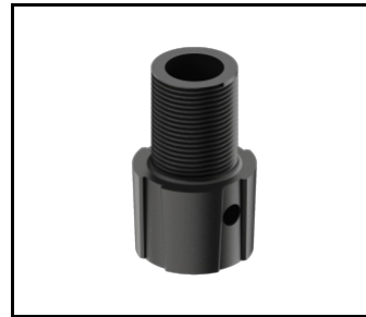
SKVER R adapter męski gwint 1 cal x40 (gaz) (804434)