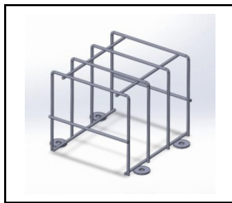
Ochranná mřížka Senzor Hytronik HIM84 RAL 9003 (598913)