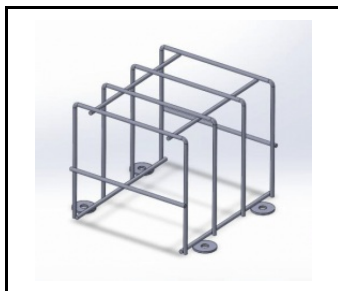
Ochranná mřížka Sensor Hytronik HIM84 RAL 9003 (598913)