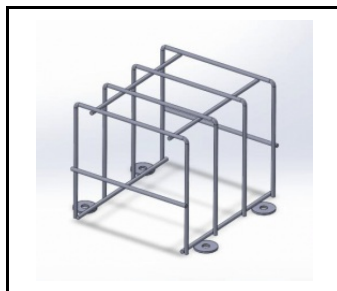
Ochranná mřížka Senzor Hytronik HIM84 RAL 9003 (598913)