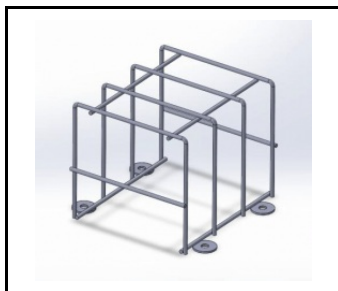
Ochranná mřížka Senzor Hytronik HIM84 RAL 9003 (598913)