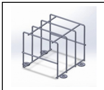
Ochranná mřížka Senzor Hytronik HIM84 RAL 9003 (80001265)