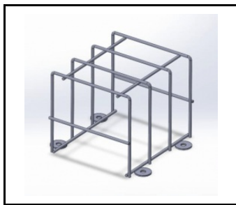
Ochranná mřížka Senzor Hytronik HIM84 RAL 9003 (598913)