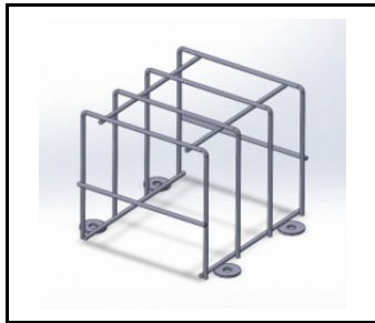
Ochranná mřížka Senzor Hytronik HIM84 RAL 9003 (598913)