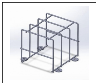
Grille de protection Capteur Hytronik HIM84 RAL 9003 (598913)

Date de création de la carte: 04 novembre 2025